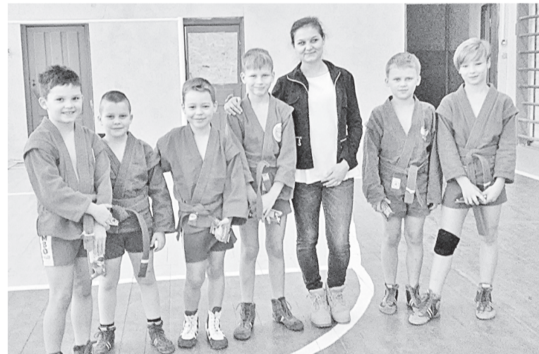
Юные самбисты ЦФКиС «Боровичи»

Нецелевые потребительские кредиты по программе кредитования «Смотри - 7,77%» на суммы от 100 000 до 275 000 рублей на срок 13 месяцев. Ставки: с 1 по 3 месяц - 28% годовых, 4 по 6 месяц - 25% годовых, с 7 по 9 месяц - 15% годовых, с 10 по 13 месяц - 7,77% годовых. Банк выдает кредит при предоставлении паспорта, второго документа, подтверждающего личность, после проведения финансовым консультантом кредитного интервью (беседы) и принятия положительного решения Банком. Банк вправе отказать в выдаче кредита. Подробности по программе кредитования (в т.ч. требования к Заёмщику) в офисах Банка и на сайте www.poidem.ru . Не оферта. АО КБ «Пойдем!». Лицензия Банка России № 2534. Реклама